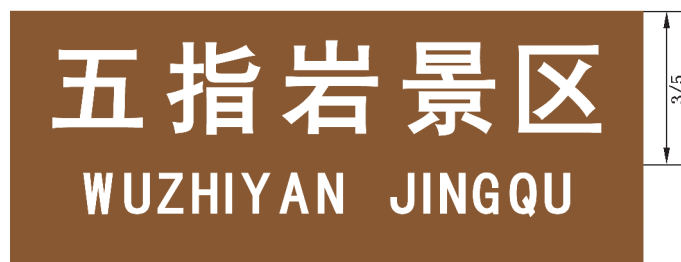
图 B.10 纪念地和旅游地地名标志版面示例