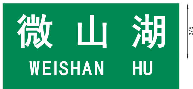
图 B.2 水系地名标志版面示例