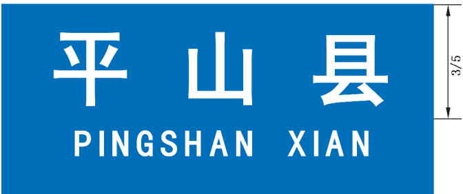
图 B.6 县级地名标志版面示例