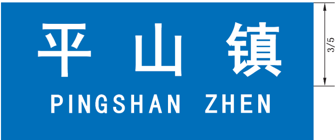
图 B.7 乡级地名标志版面示例