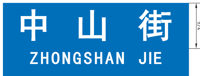
图 B.11 街地名标志版面示例