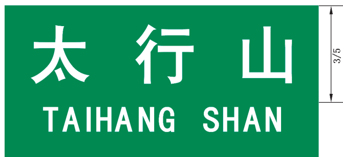
图 B.3 地形地名标志版面示例