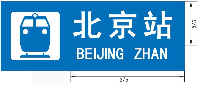
图 B.22 带有图形符号的地名标志版面示例