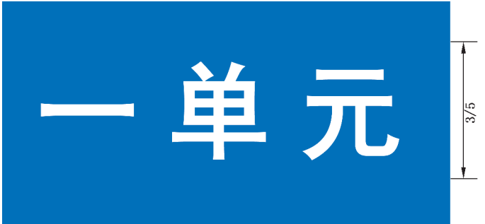
图 B. 18 楼单元地名标志版面示例