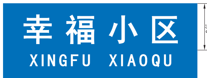
图 B.14 小区地名标志版面示例