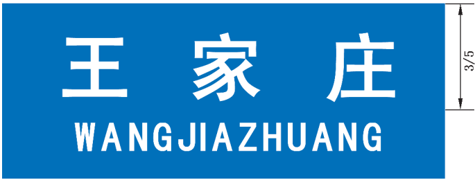
图 B. 15 村地名标志版面示例