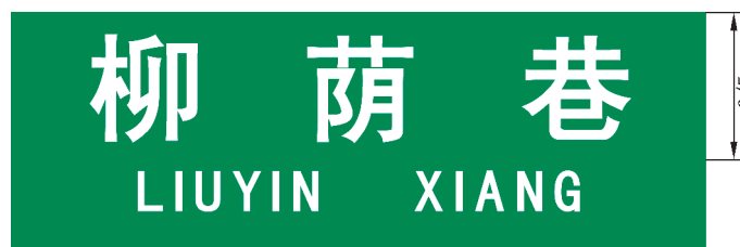
图 B.12 巷地名标志版面示例