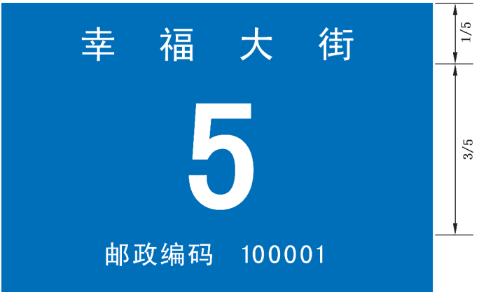
图 B.24 带有邮政编码的地名标志版面示例