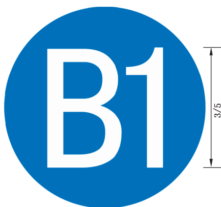
图 B. 19 楼层地名标志版面示例