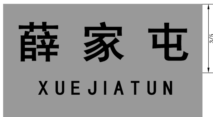
图 B. 21 横置的碑碣式地名标志版面示例