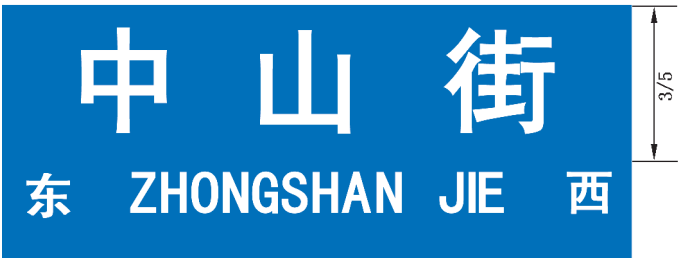
图 B.23 带有指示方向信息的地名标志版面示例