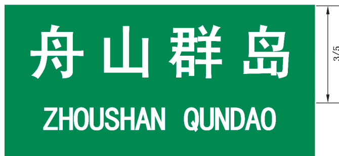
图 B.1 海域地名标志版面示例