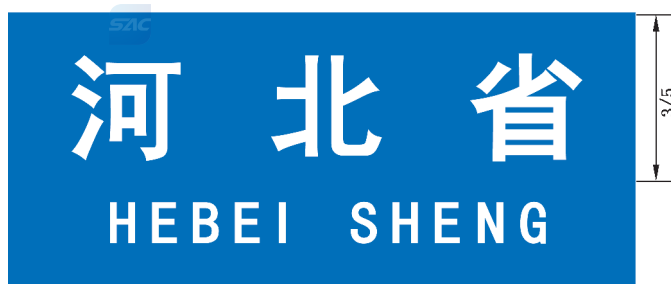
图 B.4 省级地名标志版面示例