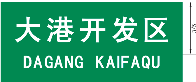
图 B.8 专业区地名标志版面示例