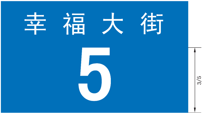
图 B. 17 门地名标志版面示例