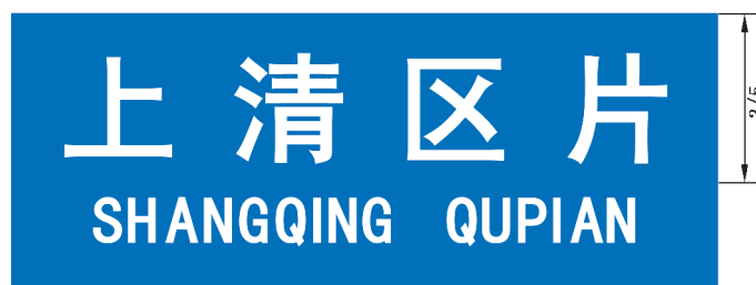
图 B.13 区片地名标志版面示例