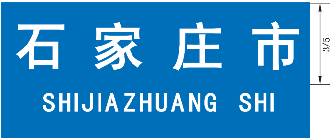
图 B.5 地级地名标志版面示例