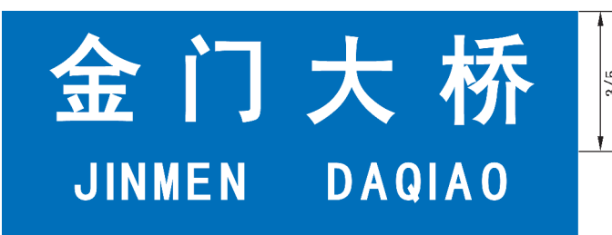
图 B.9 设施地名标志版面示例